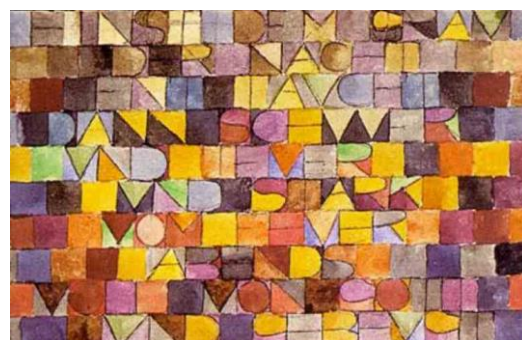
Paul Klee, Dapprima innalzatosi dal grigiore della notte, 1918

Sala Monicelli, Centro Benedetta D'Intino, Milano